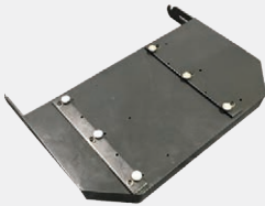
SP302601 EXTENSION ÉLÉVATEUR