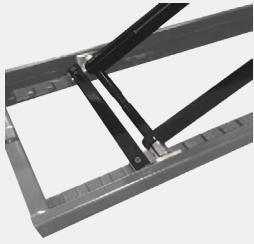
Système de sécurité